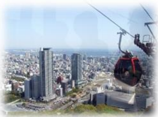
ゴンドラで山上へ