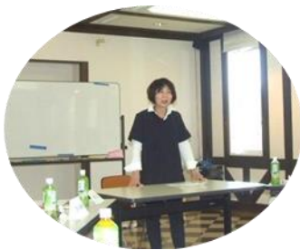
教育「儀典について」